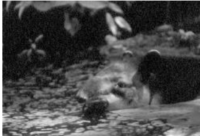
Tapir centoamericano, Tapirus bairdii .

día. Estos animales habitan una amplia variedad de ambientes tropicales y subtropicales, que abarcan selvas, humedales, bosques mesófilos, encinares y aun páramos centroamericanos a más de 3 000 m de altitud. En México se le encuentra en áreas con grandes extensiones forestales (decenas de miles de hectáreas) y escasa actividad humana en los estados de Campeche, Chiapas, Quintana Roo, Oaxaca y Veracruz (fig. 1).